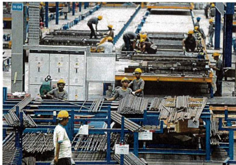
We cannot have a sustainable economy without the right conditions and justice for our workforce. FILE PIC

We have a situation where employment security seems to be a