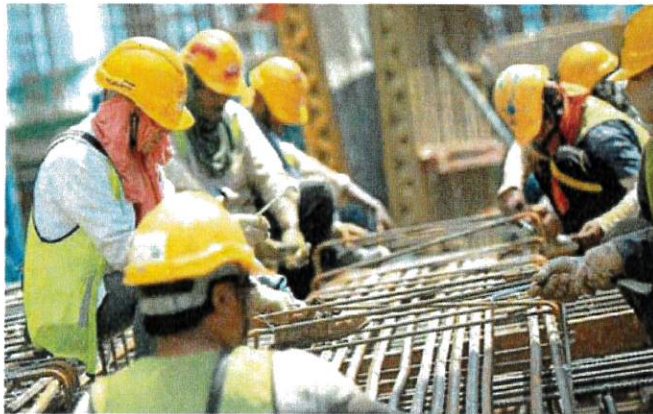
内阁同意于今年7月1日起，所有工商领域重启替代外劳机制，获工商组织一片叫好。图为建筑劳工正在烈日下辛勤工作。

报导称，政府将通过重启离境备忘录的方式进行替代外劳机制，即当外劳回国后，雇主无需提出新的申请，他们可自动获得替代外劳。古拉认为，这样的机制不会导致外劳增加，而是维持已批准于雇主的外劳人数，不仅省时省钱，还能进一步解决各行各业外劳短缺问题，同时确保生产力和出口不受影响。