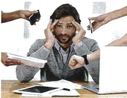
LELAKI juga tidak lari daripada diskriminasi di pejabat selepas mempunyai anak.

Sebagai anak, tentu kita sedia maklum betapa peritnya cabaran ibu bapa membesarkan zuriat mereka supaya menjadi orang berguna. Lihatlah bagaimana kita sendiri bergelut dengan bebanan kerja di pejabat setiap hari. Inikan pula ibu bapa yang terpaksa keluar bekerja mencari nafkah buat keluarga, menggalas tanggungjawab membesarkan anak-anak dan menjaga kedua-dua orang tua mereka.