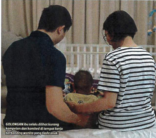
GOLONGAN ibu selalu dilihat kurang kompeten dan komited di tempat kerja berbanding wanita yang tiada anak