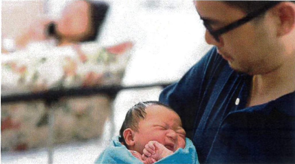
Kemudahan cuti paterniti kepada bapa membantu melancarkan urusan keluarga dan menyesuaikan diri bersama bayi.