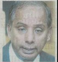
M Kulasegaran, Menteri Sumber Manusia

➔ 385,000 pekerja asing peroleh perlindungan sejak kerajaan wajib dasar 1 Januari lalu