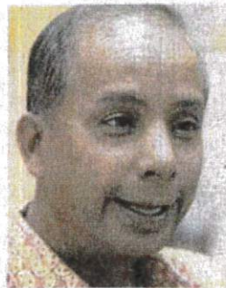
M. KULA SEGARAN

Menterinya, M. Kula Segaran berkata, pihak kementerian mengadakan mesyuarat setiap bulan bersama MTUC dan Persekutuan Majikan-majikan Malaysia (MEF) bagi menganalisis sebarang cadangan yang dibangkitkan sebelum membuat sebarang keputusan.